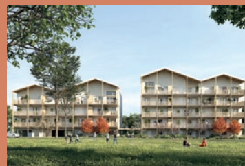
INSPIRE / Villefranche-sur-Saône