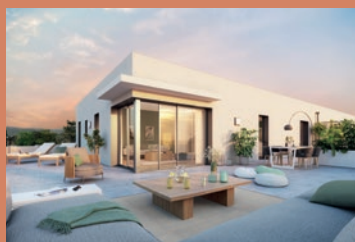
ILEX / Francheville