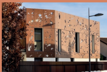
INITIALE / Chassieu