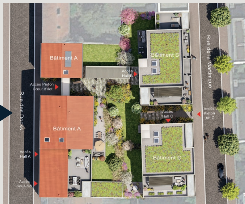
Rue des Docks.

Cette réinterprétation contemporaine du style traditionnel lyonnais, porte la signature patrimoniale des réalisations de caractère.