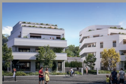
ROOF / Lyon 9 e