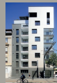
ALLURE / Lyon 8 e