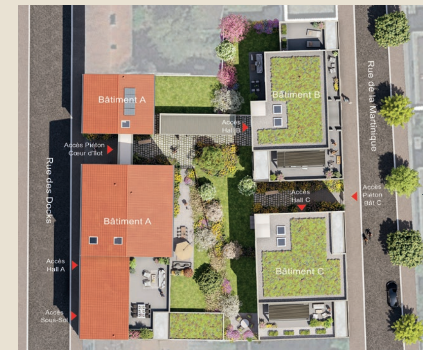
Rue de la Martinique.

En façade, le mélange des teintes et matières entre les enduits et le parement pierre forment un accord harmonieux, qui souligne le soin porté à l'esthétique du projet.