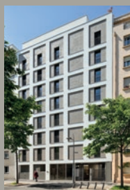
EKO / Villeurbanne

Recherche du terrain, sélection de l'architecte, choix des matériaux, l'expérience et les compétences des équipes sont tournées vers un seul but : satisfaire les acquéreurs et les investisseurs les plus exigeants.